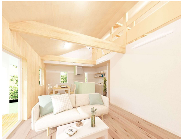
※外観、内観パースはイメージです