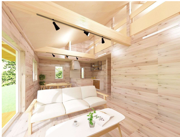
※外観、内観パースはイメージです