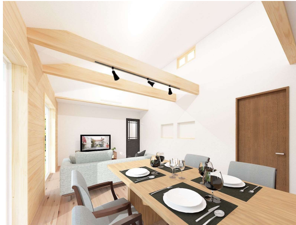
※外観、内観パースはイメージです