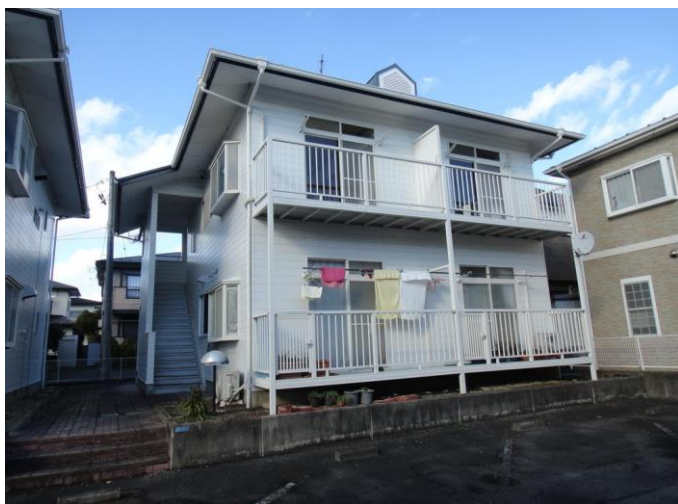
仙台市地下鉄南北線 長町南駅 徒歩17分